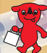
千葉県マスコットキャラクター ちばくん